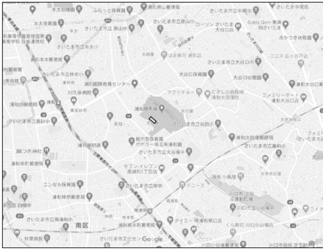
付近見取図 Non scale